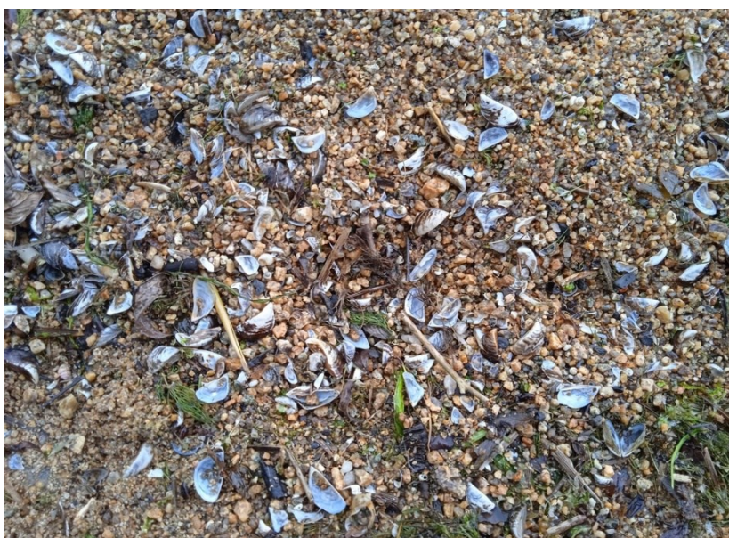
Figure 2 Coquillages de moules zébrées sur une plage

La présence des moules envahissantes est associée avec une augmentation des éclosions de cyanobactéries, ou algues bleu-vert. Certaines cyanobactéries sont toxiques pour les humains et causent des enjeux de santé publique. Par conséquent, la présence de cyanobactéries dans un plan d'eau peut provoquer la fermeture des plages et la décontamination des eaux. Les coquillages des moules qui peuvent être retrouvés sur les plages sont également très coupants, et peuvent par conséquent provoquer des blessures. La présence de coquillages coupants en grand nombre sur les plages, principalement après des tempêtes, rend les plages moins attrayantes et oblige les usagers à porter des souliers. Cette situation est notamment observable régulièrement autour des Grands Lacs. Les coquillages peuvent être retirés des plages, mais ces efforts représentent un coût budgétaire.