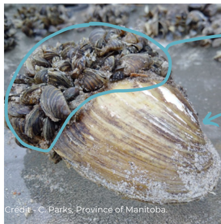
Moules zébrées (attachées et plus petites)