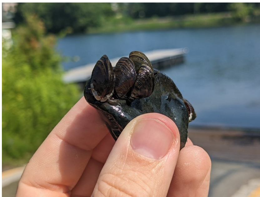
Figure 1: Moules zébrées sur rocher ; crédit photo : David O'Connor.

Les moules envahissantes atteignent leur maturité sexuelle en quelques mois seulement. La reproduction est externe et s'effectue lorsque la température de l'eau dépasse les 10 °C. La reproduction peut cependant se dérouler dans des eaux plus froides, si certaines conditions sont regroupées. Les femelles sont très fécondes et peuvent pondre entre 30 000 et 1 000 000 d'œufs par année. Les larves, appelées véligères, sont invisibles à l'œil nu. Elles restent en suspension dans l'eau pendant 15 à 30 jours selon la température avant de s'accrocher à un substrat, et peuvent par conséquent être facilement transportées par les courants sur de longues distances. Les véligères circulent librement dans les eaux avant de s'attacher sur toute surface solide dans un plan d'eau. Les moules zébrées préfèrent souvent les profondeurs de 1 à 9 m de l'eau, tandis que les moules quaggas peuvent se retrouver à toutes les profondeurs. Certaines ont été retrouvées à plus de 150 m de profondeur dans les Grands Lacs.