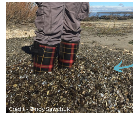
Plage infestée de moules zébrées